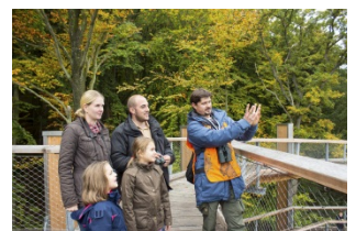
Einmal im Monat reisen die Naturführer mit Besuchern in „Die Welt des Zauberbaums“, einer Märchenwanderung für die ganze Familie.