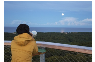
„Zauberlaterne“ heißt die Vollmondwanderung für Nachtschwärmer im Naturerbe Zentrum Rügen.

Telefon: 038393 / 66 22 11 Mobil: 0160 / 909 707 36 E-Mail: mana.peter@nezr.de